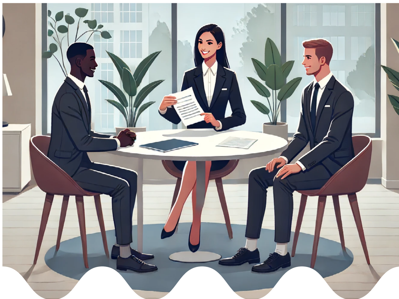
Illustration générée par DALLE-2