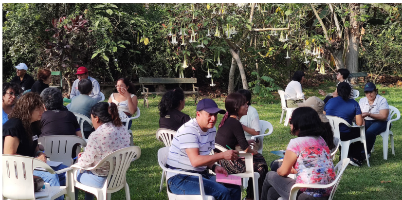
Fecha: Diciembre 13, 2023

Estimular la reflexión crítica sobre las prácticas actuales y fomentar la aplicación de los aprendizajes.