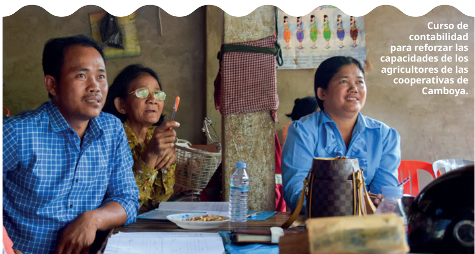
Curso de contabilidad para reforzar las capacidades de los agricultores de las cooperativas de Camboya.