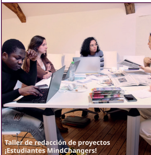
Taller de redacción de proyectos ¡Estudiantes MindChangers!