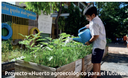
Proyecto «Huerto agroecológico para el futuro»