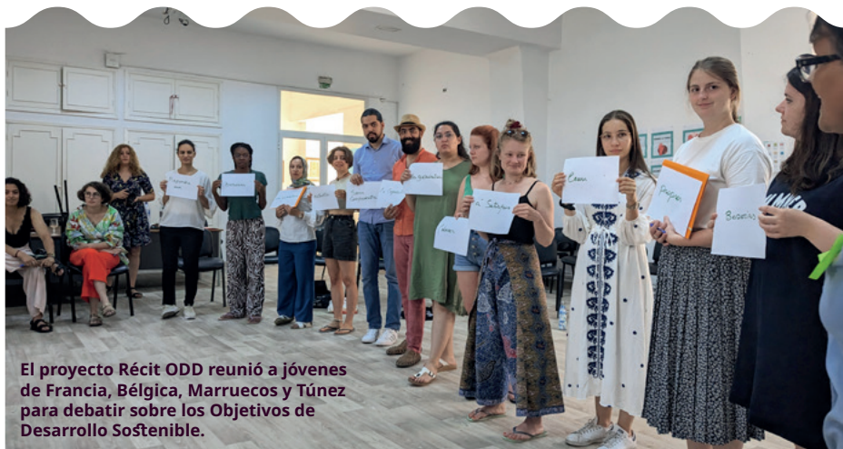
El proyecto Récit ODD reunió a jóvenes de Francia, Bélgica, Marruecos y Túnez para debatir sobre los Objetivos de Desarrollo Sostenible.