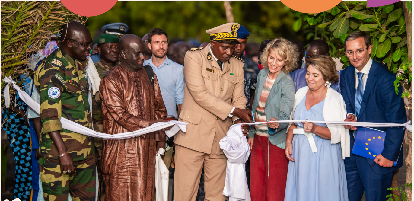
^ Cérémonie d'ouverture du festival Mangal à Toubacouta en présence des autorités, des ambassadrices de France et du Royaume de Belgique et de l'Union Européenne