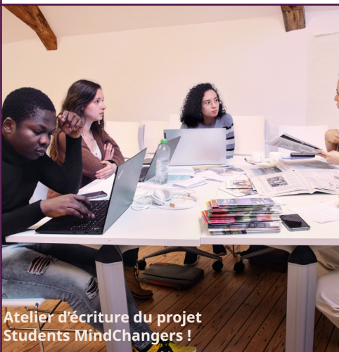
Atelier d'écriture du projet Students MindChangers !