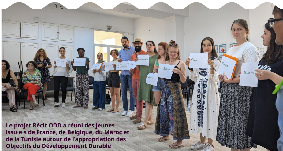
Le projet Récit ODD a réuni des jeunes issus-e-s de France, de Belgique, du Maroc et de la Tunisie autour de l'appropriation des Objectifs de Développement Durable