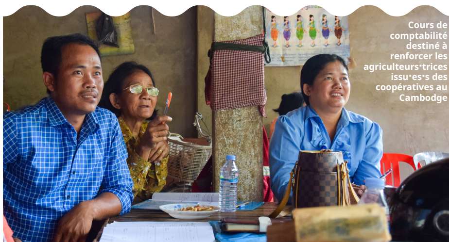
Cours de comptabilité destiné à renforcer les agriculteurs·trices issu·es·s des coopératives au Cambodge