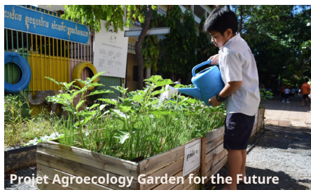
Projet Agroecology Garden for the Future