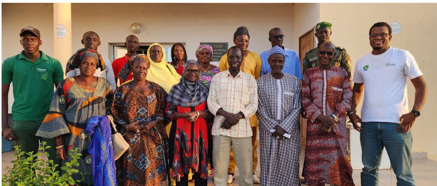
Photo de famille UNI4COOP et ses partenaires lors de l'atelier du diagnostic SAD avec l'outil TAPE de la FAO

Au Bénin , l'étude a été menée dans les communes de Tchaourou, N'Dali et Toucountouna pour caractériser le niveau de transition agroécologique atteint par les producteurs.trices des 15 villages d'intervention du projet avec l'outil TAPE de la FAO. Un effectif total de 152 producteurs (20% des bénéficiaires) a été enquêté. Le choix de enquêtés est fait de façon aléatoire et raisonnée sur le genre. Les résultats obtenus de ce diagnostic ont permis à l'équipe du projet de faire une planification des activités pour le compte de 2023 en tenant compte des besoins des bénéficiaires. Il est également prévu d'organiser des assemblées villageoises pour restituer les résultats de diagnostic et définir les trajets de transition de manière participatives avec les bénéficiaires . Un guide de restitution est en cours de conception à l'attention des techniciens du programme