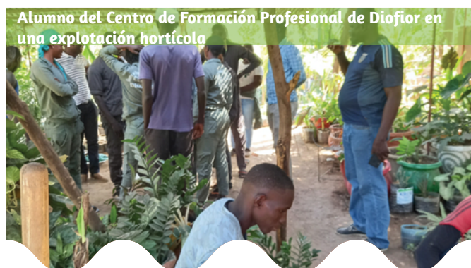
Alumno del Centro de Formación Profesional de Diofior en una explotación hortícola