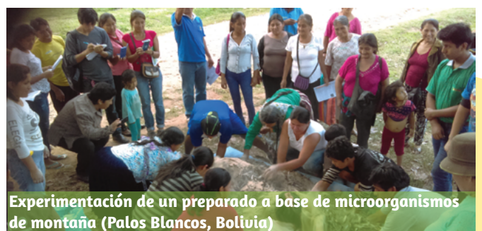
Experimentación de un preparado a base de microorganismos de montaña (Palos Blancos, Bolivia)

El programa 2017-2021 también deja un buen número de publicaciones, especialmente tras el proceso de capitalización final de las distintas experiencias. Esto abre nuevos retos y perspectivas hacia un conocimiento más inclusivo que contribuya al cambio y a la promoción.