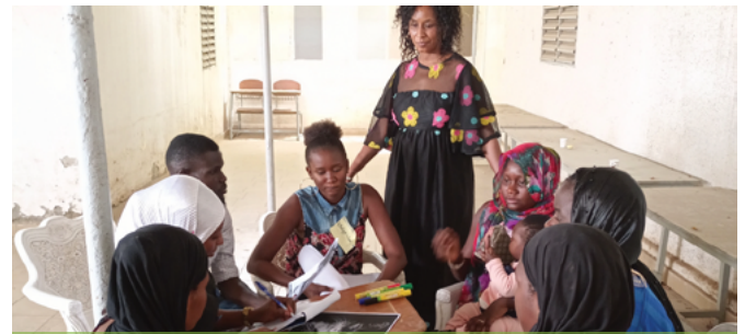
Formación sobre la idea del proyecto

El objetivo de IDEAL es reforzar el sistema de formación profesional y técnica, y mejorar el apoyo a la inserción profesional y al espíritu empresarial, para que la oferta se adapte mejor a las necesidades económicas de estas regiones. Para ello, Eclasio y el GRET facilitan la concertación entre los distintos actores de la sociedad civil y el sector privado, evaluando las perspectivas de empleo de estas regiones y apoyando los mecanismos de apoyo existentes para la inserción profesional y el emprendimiento.