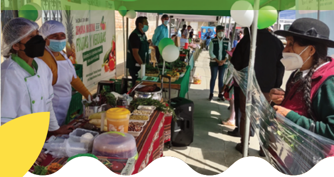
Mercado ecológico en Huaraz (Perú)