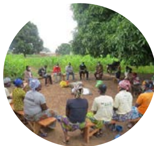
Formation des bénéficiaires sur l'enrobage de l'urée à l'huile de neem à Kampouya