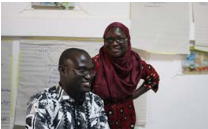
Atelier stratégique Eclosio à Saly portudal

La période du confinement a été l'occasion pour Eclosio de réaliser une enquête sur le bien-être au travail au Bénin et au Sénégal. Le programme d'Eclosio en Afrique de l'Ouest a connu une forte progression ces dernières années et atteint un effectif considérable – 41 collabora-