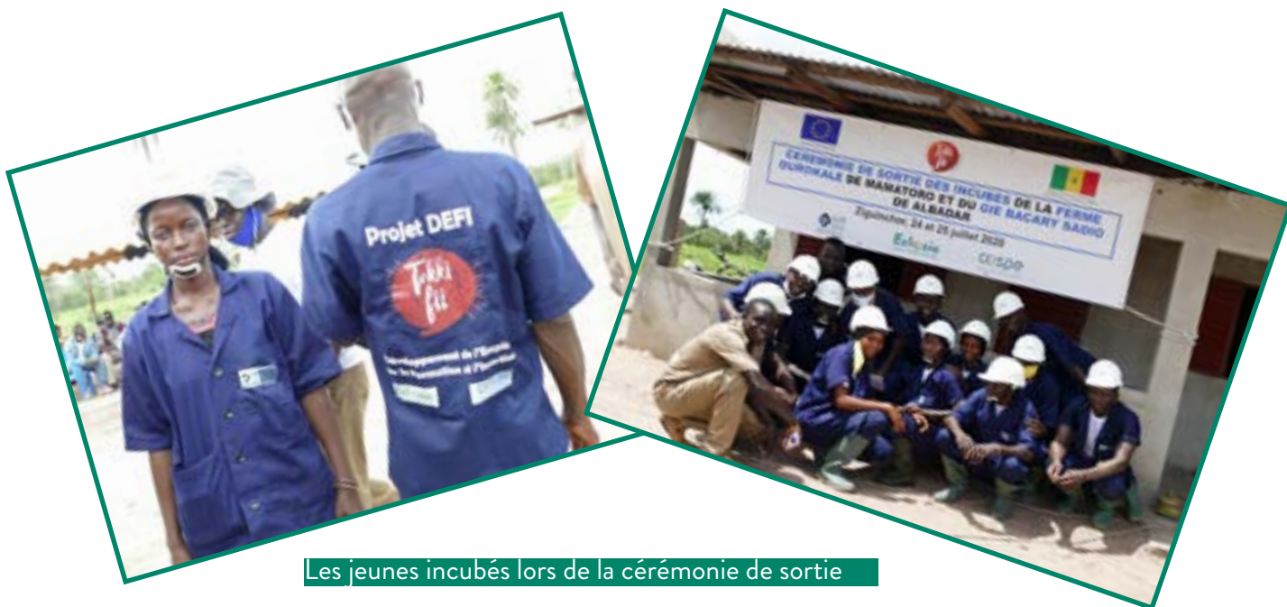
Les jeunes incubés lors de la cérémonie de sortie

Dès la levée des restrictions, une célébration a eu lieu les 24 et 25 Juillet pour mettre en lumière le parcours de 28 futurs entrepreneurs formés aux techniques de production maraichères, d'arboriculture fruitière et d'élevage entre autres en Casamance.