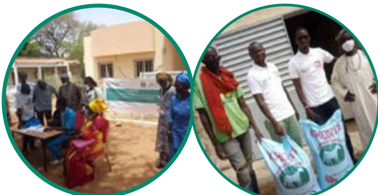
Distribution de l'appui en intrants à Ngoye

A l'instar de nombreuses ONGs, Eclosio a dû s'orienter vers une transformation digitale, avec la mise en place d'une part du télétravail et le recours à certains outils TIC pour permettre un accompagnement à distance auprès des partenaires locaux et des bénéficiaires des projets.