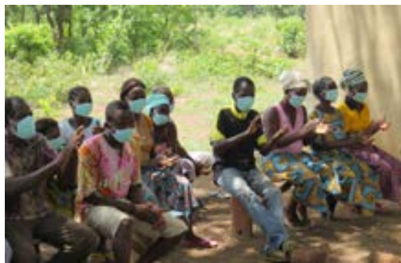
Sensibilisation dans les villages en période de Covid

Dans les neuf communes d'intervention, les techniciens ont pu organiser en moyenne 5 formations /sensibilisations par commune sur diverses thématiques en lien avec les activités des projets en général et sur les mesures barrières à la propagation de la COVID-19.