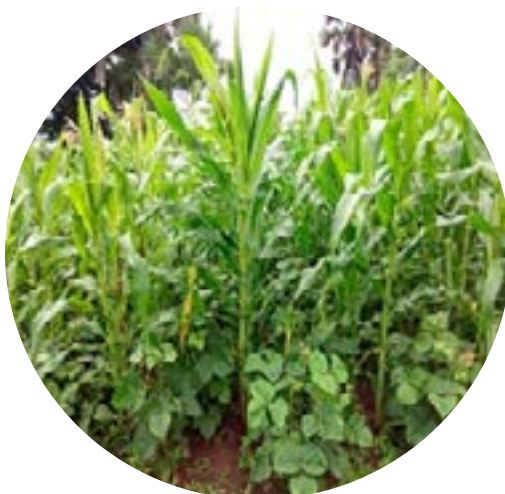
Association maïs+lentille à Pehunco