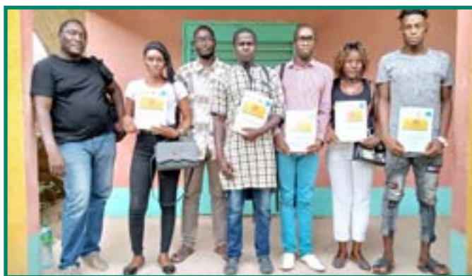
Jeunes incubés formés en Marketing et Techniques de Vente

Dans le domaine de l'accompagnement entrepreneurial et de l'insertion économique, l'équipe affectée au projet « Développer l'Emploi par la Formation et l'Insertion » partie intégrante du programme ACEFOP de l'Agence Luxembourgeoise de Développement, a développé des modules de formation à distance, portant notamment sur le modèle de plan d'affaires afin d'assurer une continuité dans l'encadrement et le développement de projets d'auto emploi. Pour s'assurer de l'accès à l'outil informatique des jeunes incubés placés dans les pépinières d'entreprises, le projet a doté les responsables des pépinières en ordinateurs et renforcé le dispositif pour poursuivre la concrétisation des projets professionnels de ces jeunes.