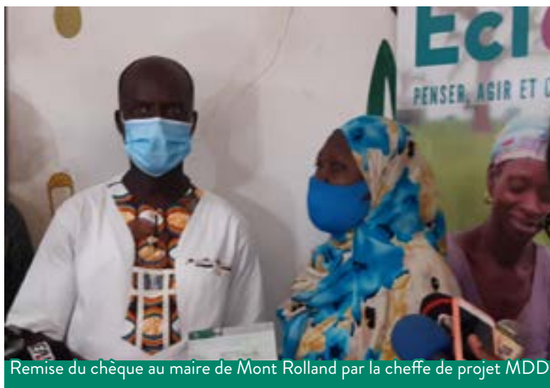
Remise du chèque au maire de Mont Rolland par la cheffe de projet MDD

Eclosio a jugé prioritaire d'ajuster son intervention en proposant un plan de riposte à la Direction Générale du Développement belge. Cette intervention spécifique vise à réduire l'impact de la crise covid19 sur la sécurité alimentaire, la nutrition et santé des ménages ruraux pauvres, en favorisant un accès inclusif des femmes aux intrants, aux services agricoles et à l'assurance maladie . Ainsi, dans le cadre du projet MDD (Modèle de Développement Durable) financé par la Direction-Générale Coopération au Développement et Aide humanitaire (DGD) Belgique, Eclosio a remis une subvention d' un million cinq cent mille (1 500 000) francs CFA à la commune de Mont Rolland comme contribution à la riposte au Covid19.