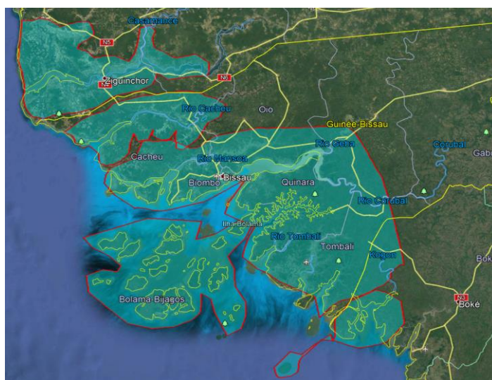
Figure 1. Paysage d'intervention