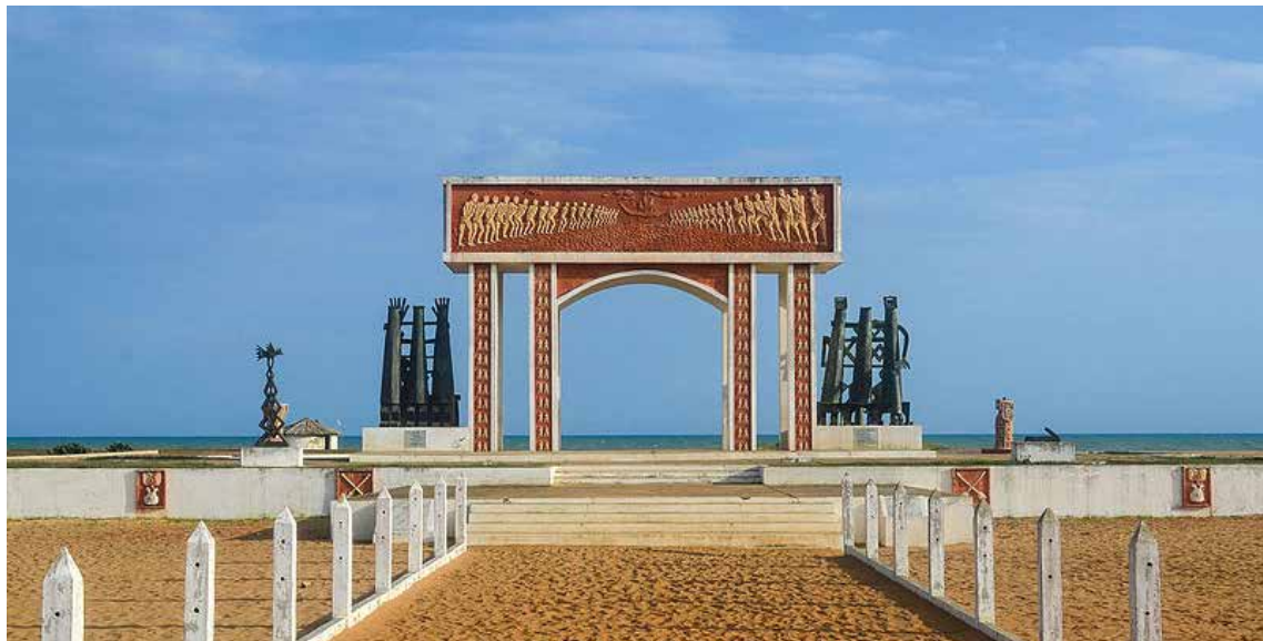
PORTE DU NON RETOUR À OUIDAH AU BÉNIN

Leur vision, fortement influencée par leurs intérêts politico-économiques, est généralement empreinte de racisme, de paternalisme et d'eurocentrisme. Cette vision partielle est en fait ce qui est parvenu jusqu'à nous et repose sur différents mensonges.