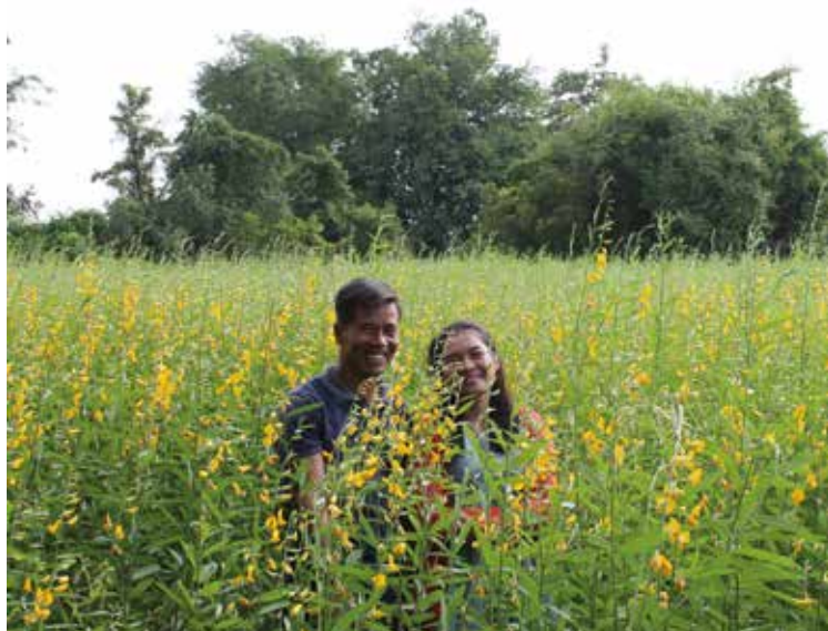
EXPÉRIMENTATION DE FERTILISATION NATURELLE AU CAMBODGE

Des alternatives en Belgique existent comme les achats en circuit court, les commerces spécialisés comme efarmz, les groupes d'achat en commun (GAC). Mais elles ont aussi certaines limites et freins comme le prix des aliments ou la gamme limitée de produits. C'est pour cette raison que de nombreuses coopératives voient le jour en Belgique. La Beescoop à Bruxelles en est un exemple. Cette coopérative permet notamment l'accès à l'alimentation durable à un maximum de personnes; encourage une économie locale en créant des partenariats sur le long terme avec des producteurs de la région; crée un espace convivial permettant de renforcer la cohésion sociale; mettre en place une politique du prix juste: un prix le plus accessible possible pour les consommateurs tout en rémunérant correctement le travail du producteur; propose une politique de transparence de l'information sur les produits et sur le fonctionnement du supermarché.